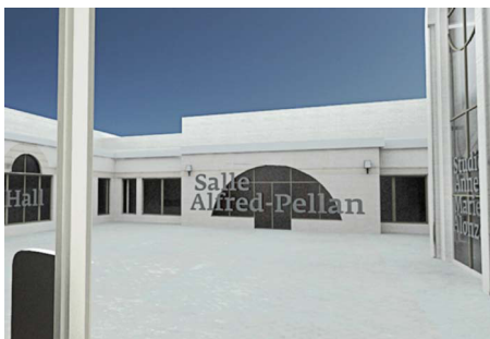
MAISON DES ARTS DE LAVAL (2013)

静的／動的両分野の空間デザインで活躍。彼の作品は都市デザイン、建築、景観デザイン、照明景観、情報景観など様々な分野を包括しており、16年間のキャリアがその中に集積されている。彼のデザインへのアプローチは、「進化する景観」というアイデアを生み出して広めていくことを目的としており、特定の空間的フレームワーク内に設置された、変化する場所を統合することにフォーカスしている。どのように変化するかはそのプロジェクトの本質次第であるが、季節の移り変わりや、人々の往来、自然の循環、場所の活性、情報の変化、特定の文脈に調和する内容などにも影響を受けるであろう。このアプローチは場所の変化を強調しているが、一方でまた、彼によって「建築的瞬間」と表現される、連続した事象の達成も重視している。